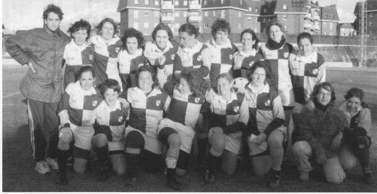
Scrum R.C. femenino