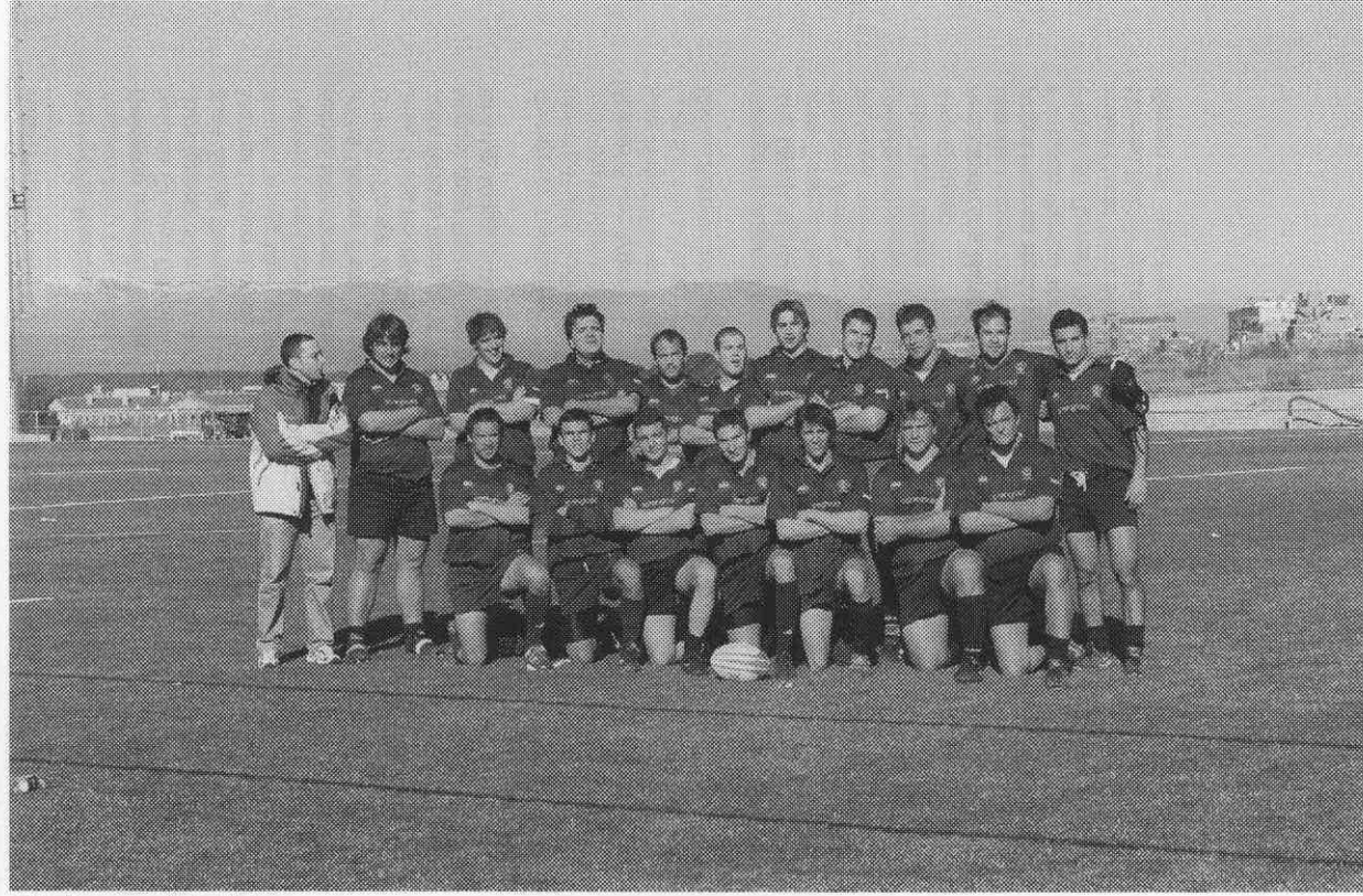
A.D. Ingenieros Industriales